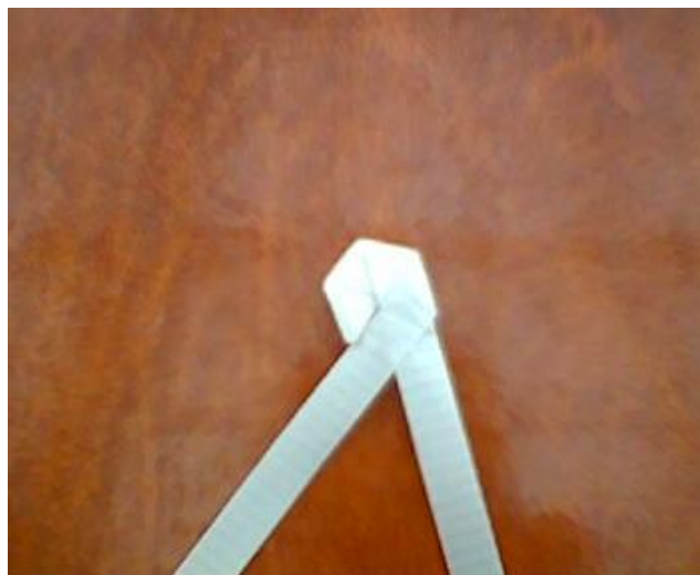
EL PRIMER CRUCE POR DEBAJO PARA QUE QUEDE ENGANCHADO