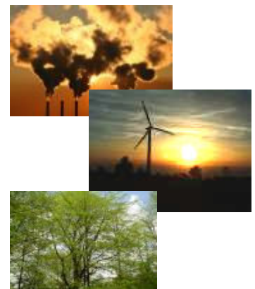
Industria, Fuentes de Energía, Medio Ambiente . . . ¿que es la sostenibilidad?

Posteriormente, una serie de publicaciones como La primavera silenciosa (Carson, (continua en Artículos )